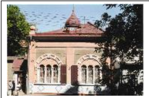
Die letzte Synagoge in Czernowitz