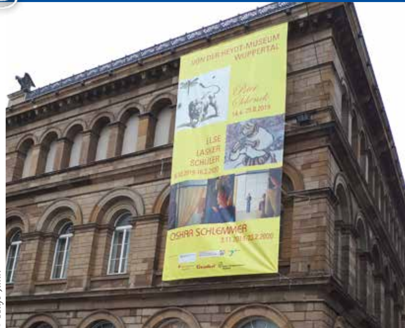
Außenwerbung am Von der Heydt-Museum Wuppertal für die Ausstellung „Prinz Jussuf und die Avantgarde“

simulierten Ertränkens, Waterboarding, weckte“. . . oder an das Ertrinken von Flüchtlingen im Mittelmeer. – Das Gedicht, das mit seinem Schlusswort „Meinwärts“ dem Jubiläumsjahr den Titel gibt, heißt „ Weltflucht “. Nach dieser Performance wurden die Wasserlachen aufgewischt, während Auszüge aus Lasker-